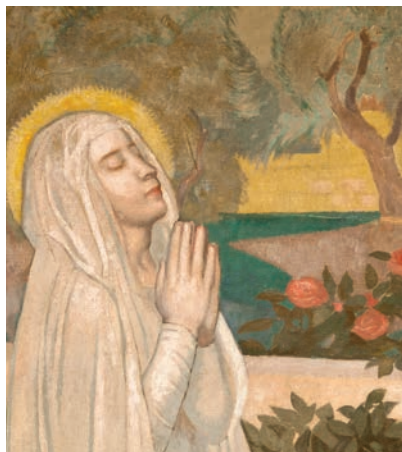
L'annonciation, Maurice Denis, 1926 - détail