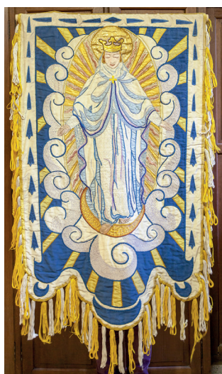
Le carnet de croquis de Maurice DENIS et la bannière exposée.